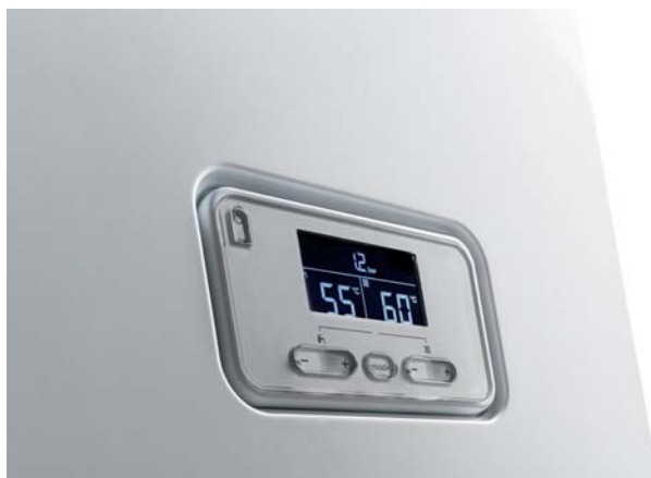
Jednoduchý ovládací panel pro snadnou obsluhu s podsvíceným displejem